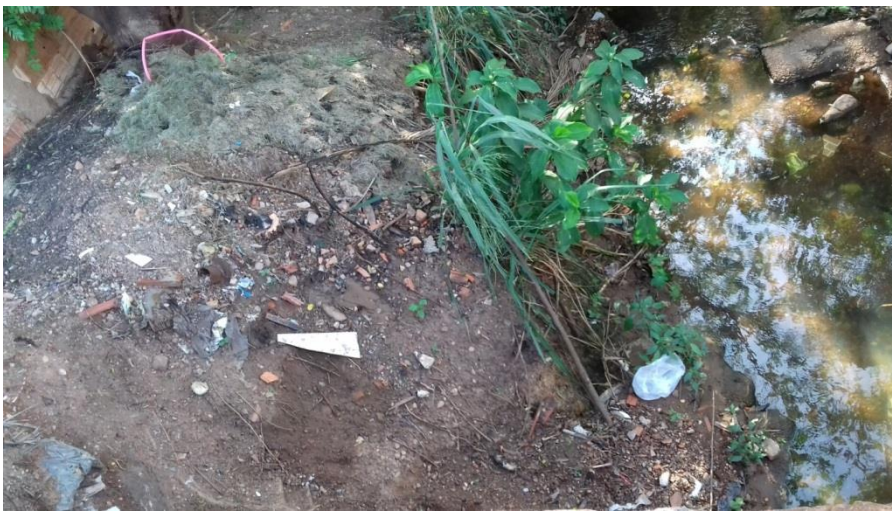
Figura 16 – Ponto amostral 6, processo erosivo na margem esquerda do rio.

As florestas de galeria, encontram-se associadas à margem de rios, e outros cursos d'água, são compostas por espécies adaptadas para suportar a força da correnteza ou eventual submersão por ocasião por enchentes (MONTEIRO, 2014). Nos trechos 6 (Fig.16) e 8 (Fig.17) foram encontradas grande supressão da vegetação ciliar, onde foram localizados processos erosivos, segundo Oliveira et al. (2011), a devastação da vegetação no entorno dos rios (mata ciliar) traz sérias implicações ao ambiente natural, como, por exemplo, assoreamento dos rios, poluição, contaminação por produtos de origem agrícola (agrotóxico) e afugentamento da fauna.