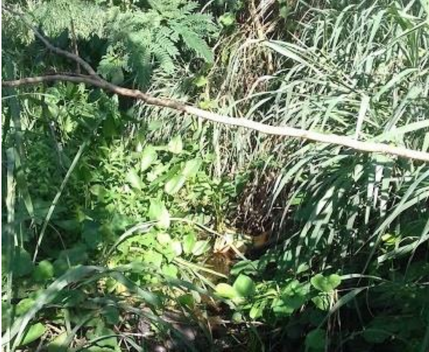
Figura 19 – Macrófitas localizadas no ponto amostral 4.