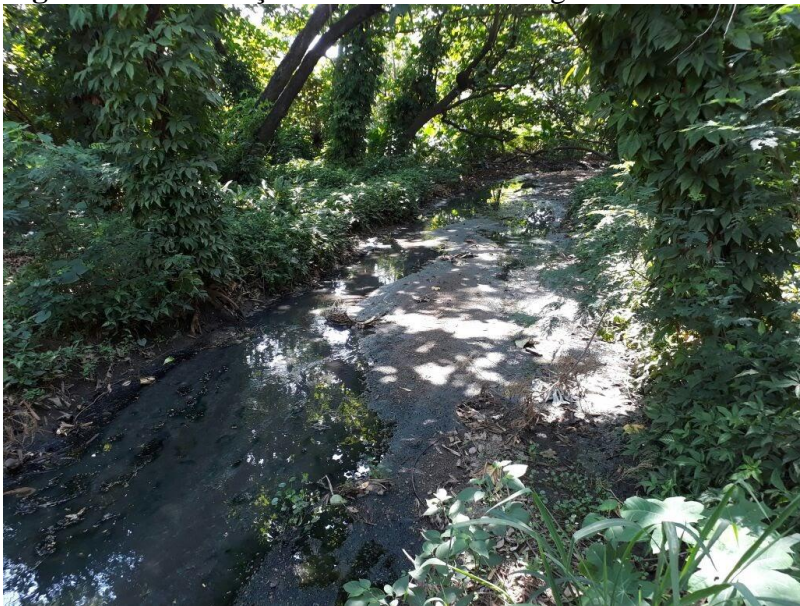
Figura 20 – Presença de lama e matéria orgânica no curso d'água, ponto amostral 2.

A deposição de lama no fundo do rio foi um parâmetro em que somente o ponto amostral 2 (Fig.20) apresentou grande quantidade de sedimento, com mais de 75% fundo do curso d'água coberto por lama, a área possui uma grande deposição de matéria orgânica, que fica retida na área.