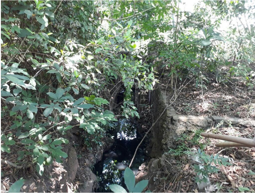
Figura 4 – Ponto 3: Trecho canalizado com pedras canga.