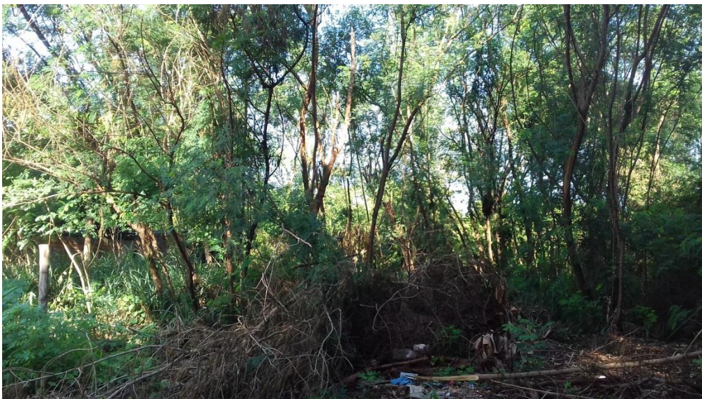
Figura 5 - Ponto amostral 4, presença de dominância da Leucaena leucocephala .

Área localizada fora dos limites do parque Tanque do Fancho, apresenta ocupação de parte de sua área de APP, possuindo vegetação secundária, com grande dominância da espécie Leucaena leucocephala (Fig.5), popularmente conhecida como Leucena.