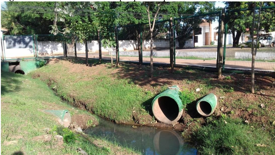
Figura 2 – Ponto 1: Entrada do parque Tanque do Fancho.

Área localizada na entrada do parque Tanque do Fancho ( Fig.2), local urbanizado com construções e avenida, com canalização realizando o lançamento de efluentes sem tratamento no local, com grande supressão da vegetação ciliar com solo exposto, não sendo preservada a Área de preservação permanente (APP).