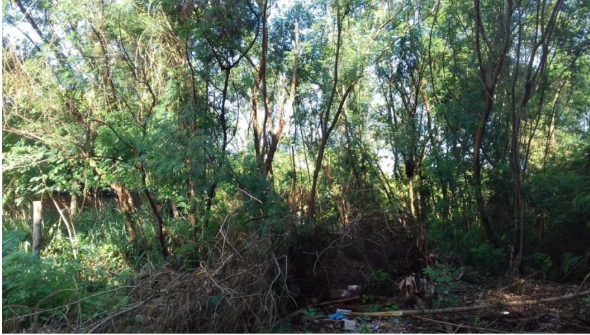
Figura 14 – Espécie de Leucaena leucocephala localizadas no ponto amostral 4.