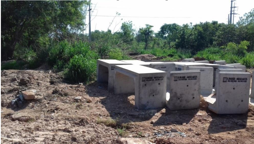
Figura 18 – Manilhas da obra presentes no ponto amostral 8.

parâmetro de estabilidade das margens, devido a uma obra realizada no local para a canalização do curso d'água, foi realizada a retirada parte da vegetação ciliar, alterando a estabilidade das margens e a paisagem local, o objetivo do manilhamento dos cursos d'água, se dá de um modo geral para que no período das chuvas devido a velocidade da água, não ocorra enchentes e erosões, que danificam estradas e causam alagamentos em bairros da região.