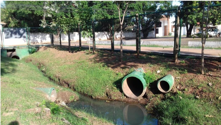
Figura 11 – Construção em área de APP, entrada do Parque do Tanque do Fancho, ponto amostral 1.