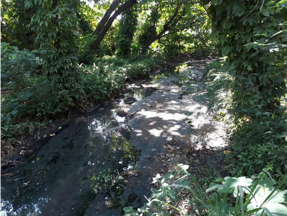
Figura 3 – Ponto 2, próximo a ponte de madeira.

Área localizada próxima a ponte de madeira (Fig.3), apresentando vegetação natural em recuperação, com impactos antrópicos nas margens moderadas, com grande deposição de lama e matéria orgânica no fundo do córrego, com margens estáveis sem presença de erosão, apresentando lançamento de efluente.