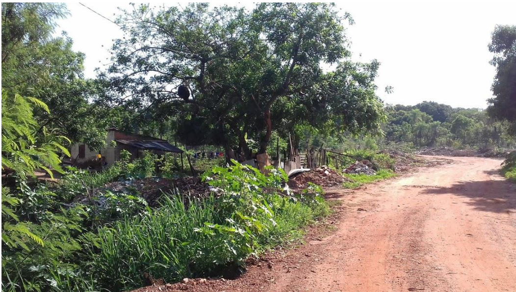
Figura 8 – Ponto 7, área com ocupação irregular e descarte de materiais de construção.

Área localizada fora dos limites do parque, apresenta grande ocupação desordenada e irregular de sua área de APP ( Fig.8), com restos de materiais de construção jogados em sua área de APP, apresentando pequenos sinais de erosão.