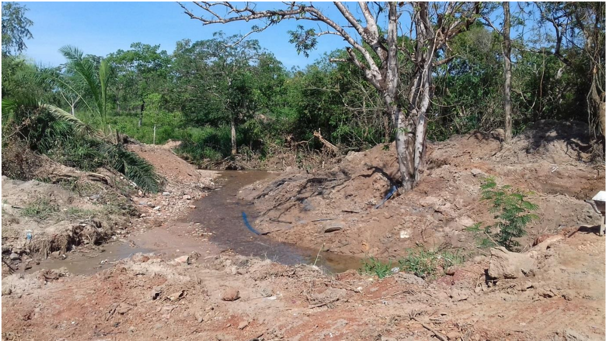
Figura 9 – Ponto 8, área com elevado processo erosivo.

Área localizada fora dos limites do parque, com obra para canalização do rio ocorrendo na data da coleta de dados, foi realizado grande supressão da vegetação ciliar e com presença de processo erosivo elevado na área de APP (Fig.9).