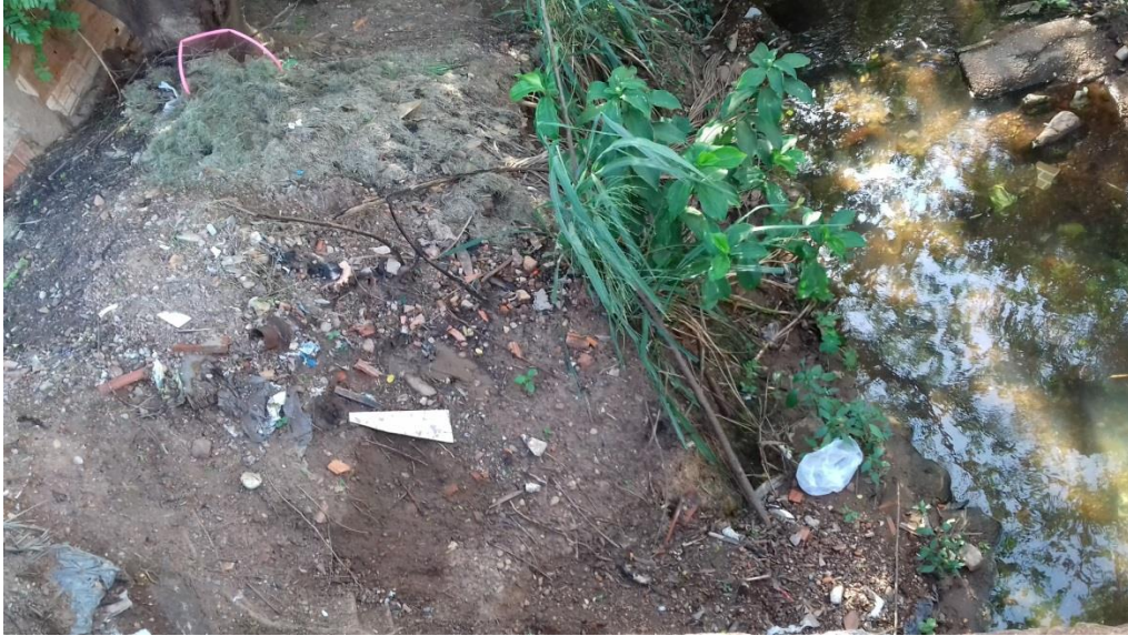
Figura 7 – Ponto 6, presença de processos erosivos.