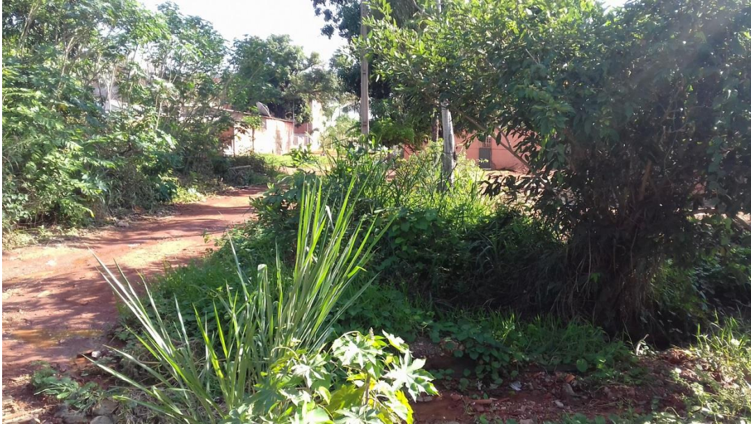
Figura 6 – Ponto 5, área com grande processo de urbanização.

Área localizada fora dos limites do parque (Fig.6), com grande processo urbanização, possuindo ocupação de sua área de APP, com residências muito próximas as margens do rio, havendo risco de enchentes durante as chuvas, não apresentando instabilidade de suas margens.