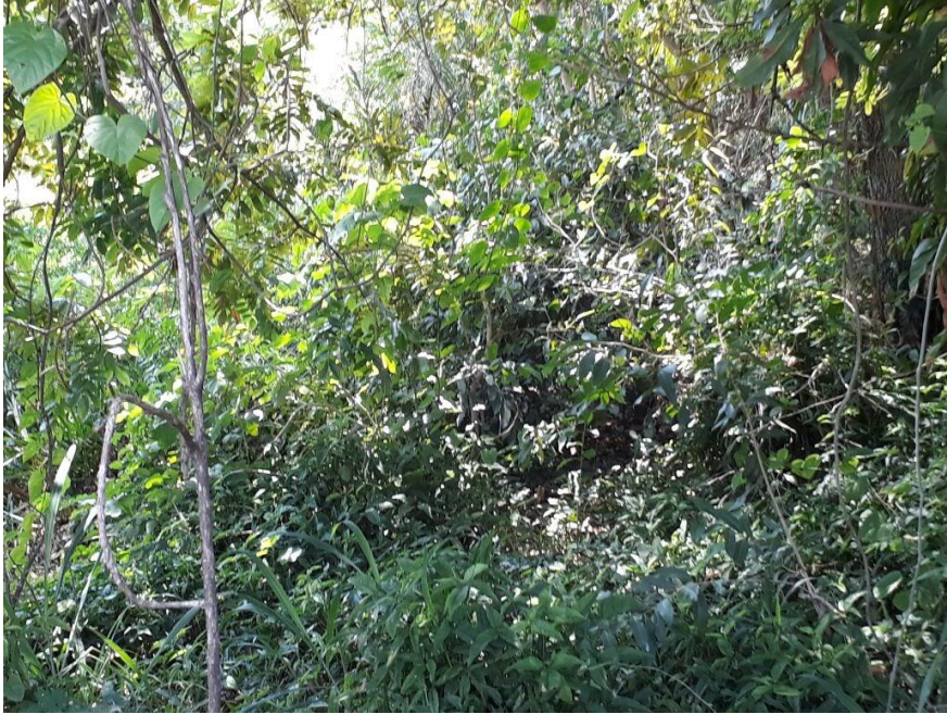
Figura 12 - Mata ciliar presente no ponto amostral 3.