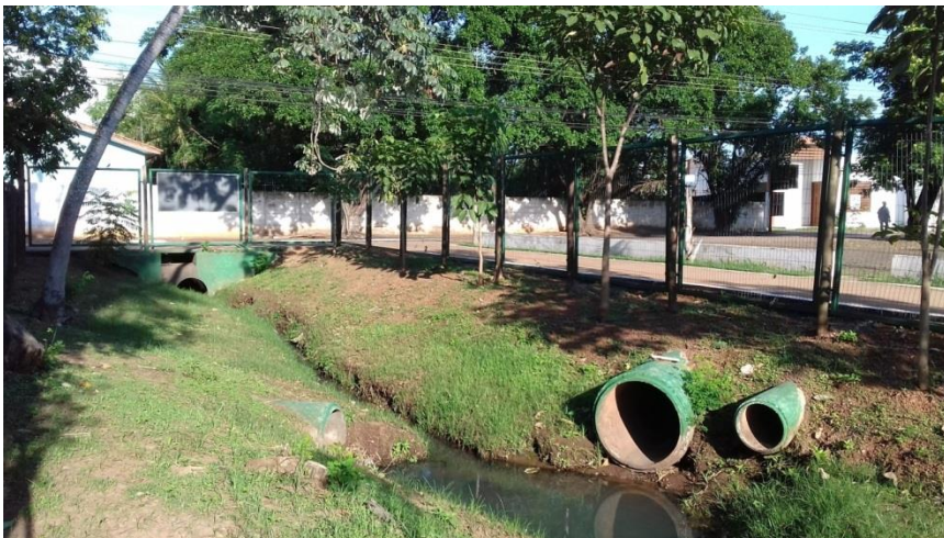
Figura 15 – Ponto amostral 1, entrada do parque Tanque do Fancho.

O ponto amostral 1 e 6, foram os que apresentaram a menor pontuação geral, em especial no parâmetro mata ciliar, com grande nível de supressão da vegetação, são áreas com ocupação/urbanizadas com construções e solo exposto ( Fig.15). com canalizações que realizam o lançamento de efluentes sem o devido tratamento no curso d'água, de acordo com Sardinha et al. (2008) além do aspecto visual desagradável, pode haver um declínio dos níveis de oxigênio dissolvido, afetando a sobrevivência dos seres de vida aquática, exalação de gases mal cheirosos e possibilidade de contaminação de animais e seres humanos pelo consumo ou contato com essa água, dentre outros aspectos.