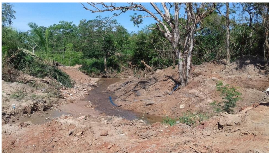
Figura 17 – Ponto amostral 8, Processo erosivo nas margens do rio.