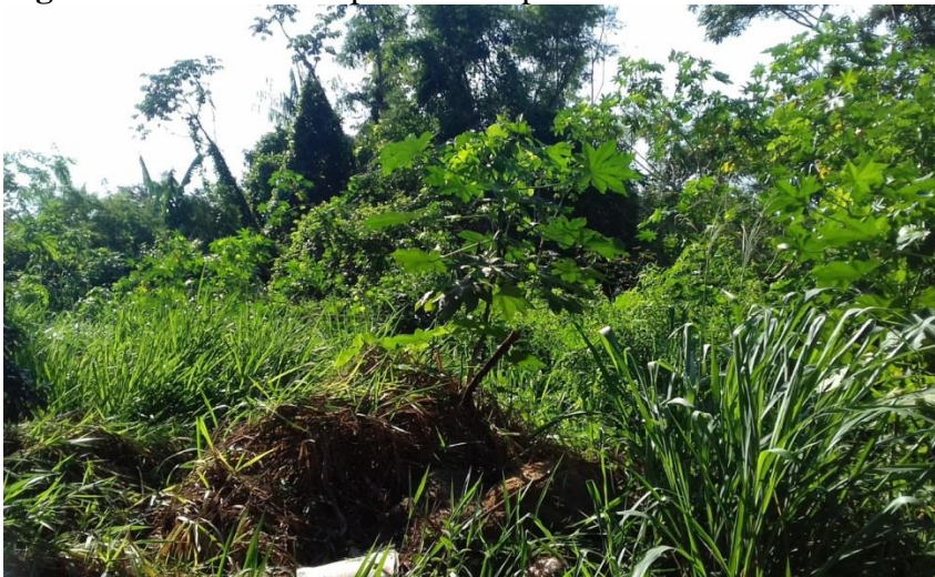
Figura 13 – Mata ciliar presente no ponto amostral 4.

O ponto 4 apresenta a melhor pontuação, 40 pontos, sendo classificada como Natural, apresenta mata ciliar em recuperação ( Fig.13), com ocupação em parte de sua APP, vegetação com grande dominância da espécie Leucaena leucocephala , popularmente conhecida como leucena (Fig.14), que apesar de possuir muitas características de espécie exótica invasora, em estudo realizado por Costa (2010), a leucena não se comportou como espécie invasora, uma vez que não se expandiu sobre ecossistemas naturais e nem mesmo ocupando novas áreas além da área de cultivo, a espécie seria, portanto, mais bem classificada como ruderal, uma vez que pode proliferar em áreas perturbadas e dificultar o estabelecimento de espécies nativas