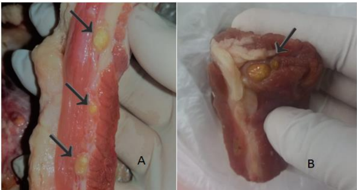
Figura 2. Aspectos macroscópicos da cisticercose bovina. (A) Lesão nodular, de coloração branca e amarelada no músculo bovino, região do contra filé. Observa-se 3 cistos de Taenia saginata com material caseoso envolto por uma capsula fibrosa. (B) Lesão nodular, de coloração amarelada, no músculo acém. Observa-se 2 cistos fibrosos. Todos os cistos foram classificados como calcificados.

As amostras analisadas em Cuiabá identificadas como ‘E’ do musculo contra filé e ‘S’ do musculo acém deram positivo e foram coletadas em regiões diferentes e em períodos com diferença de 2 meses, então não pode se deduzir que tenham um mesmo fornecedor, mas sim que estes açougues não tem uma fiscalização adequada para uma boa qualidade da carne, podendo ser carnes destinadas de abatedouros clandestinos. Todos os açougues visitados continham afixado em local visível o alvará sanitário. As carnes analisadas em Várzea Grande foram coletadas em dois períodos, no mês de março e no mês de junho de 2019, resultando em apenas 1 amostra positiva, adquirida do musculo bovino acém.