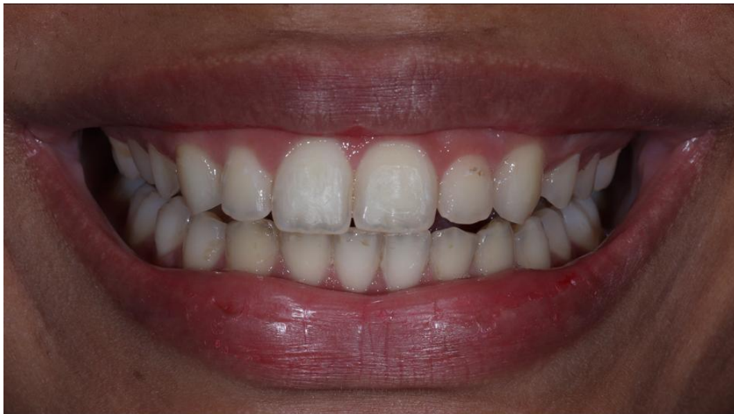
Figura 5 – Caso inicial