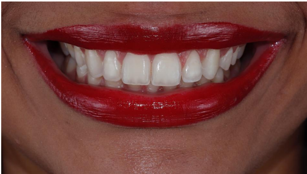
Figura 7 – caso final