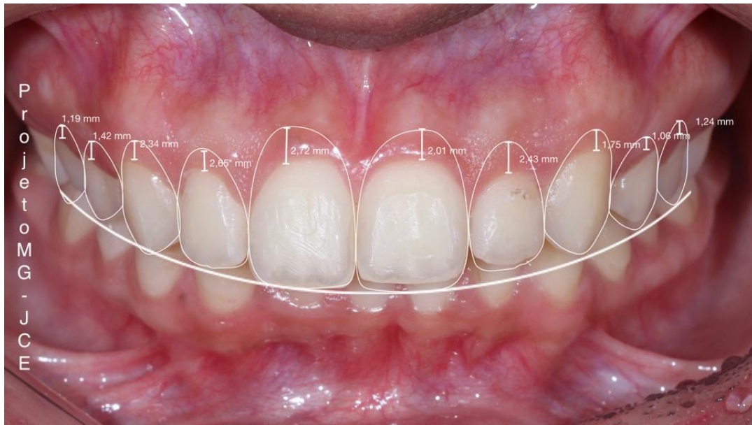
Figura 4 – Medidas para projeto