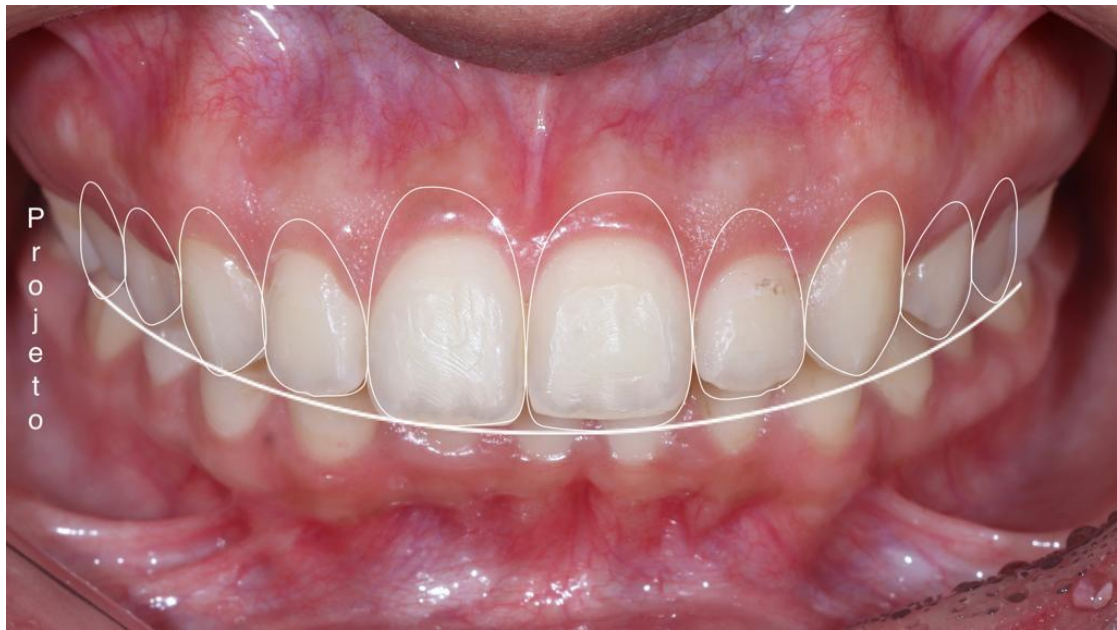
Figura 2 – Medidas para projeto