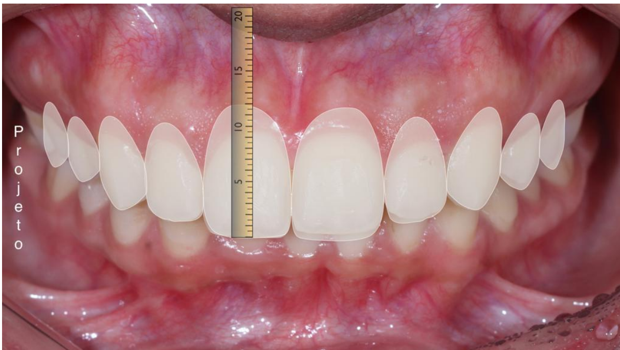
Figura 1 – Medidas para execução

E para esse fluxo de trabalho digital muito se usa o Digital Smile Design (DSD) um método no qual é possível prever os resultados que serão obtidos futuramente e traçar um planejamento adequado. Esse método é inicialmente realizado por uma sessão fotográfica da face do paciente devidamente calibrada, procurando uma vista frontal e uma vista do perfil do paciente, usando como base linhas de referências horizontais como as linhas interpupilares e intercomissural que irão possibilitar uma harmonia do sorriso com o rosto. Além disso, o marketing que para o profissional está trazendo sucesso, como meio de divulgação com maior crescimento na atualidade, através do mesmo, atingindo o público alvo, tendo como objetivo de conscientizar, na odontologia.